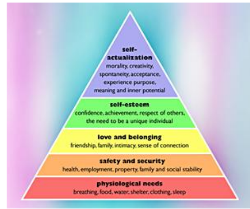
Tháp nhu cầu 5 tầng của Maslow.